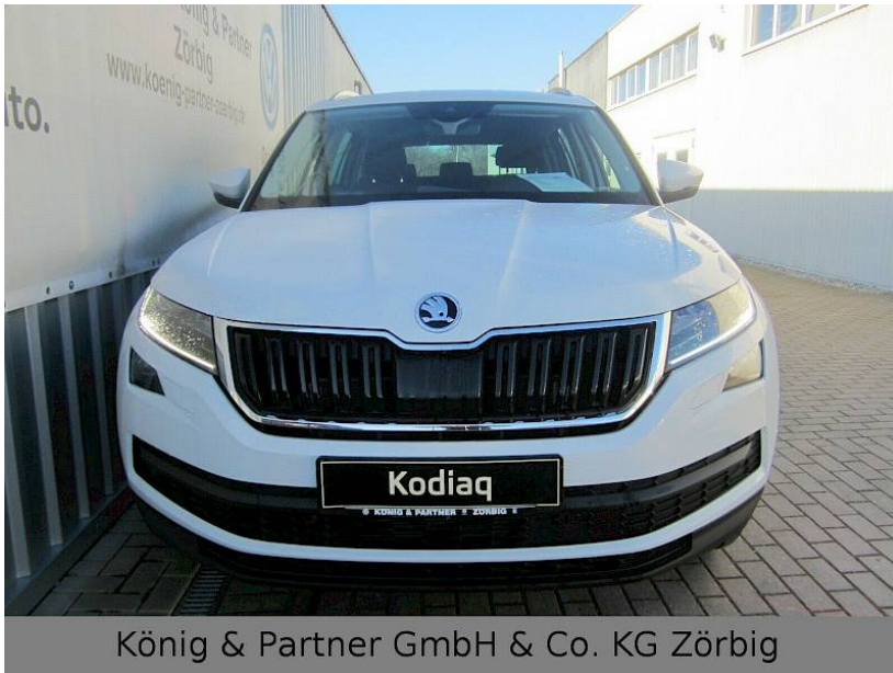
König & Partner GmbH & Co. KG Zörbig