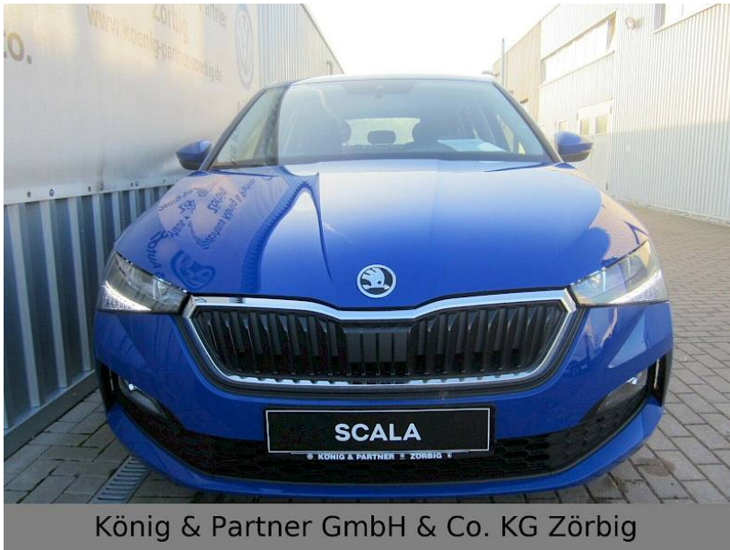
König & Partner GmbH & Co. KG Zörbig