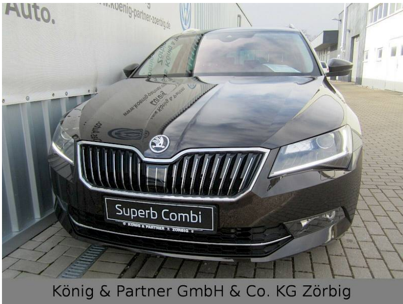
König & Partner GmbH & Co. KG Zörbig