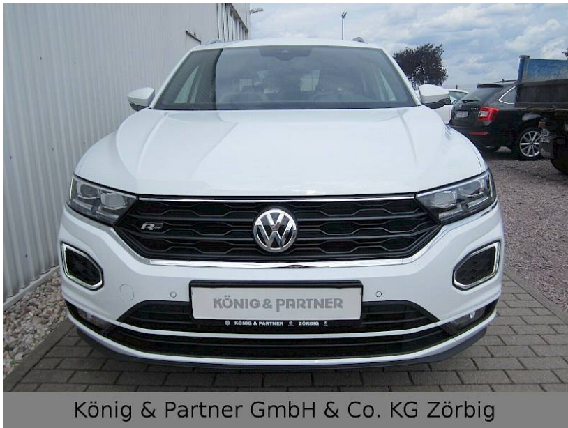
König & Partner GmbH & Co. KG Zörbig