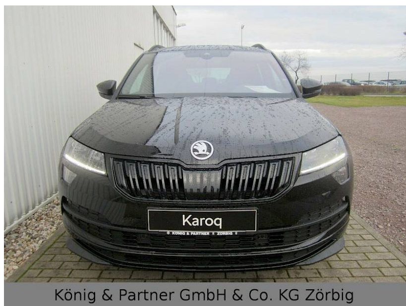
König & Partner GmbH & Co. KG Zörbig