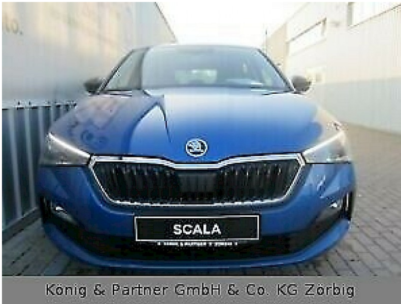
König & Partner GmbH & Co. KG Zörbig