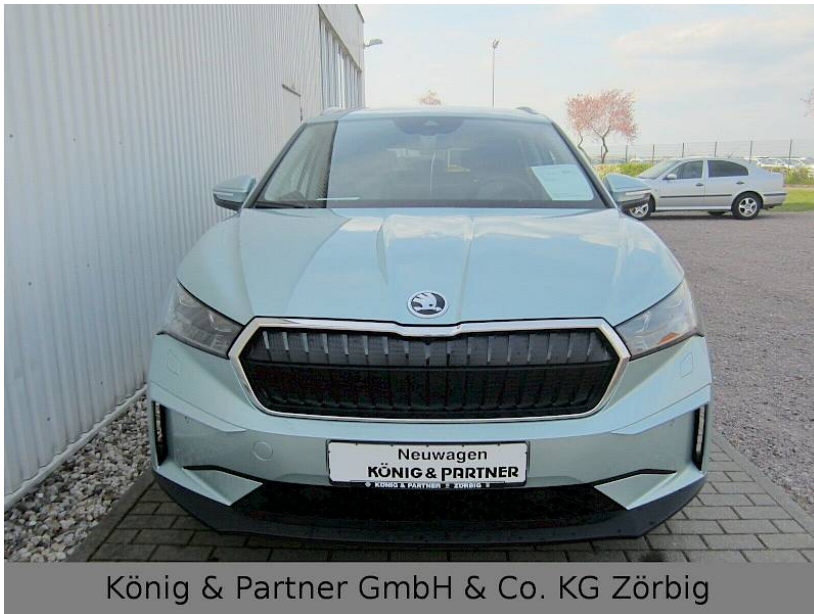
König & Partner GmbH & Co. KG Zörbig